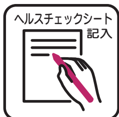
ヘルスチェックシート 記入